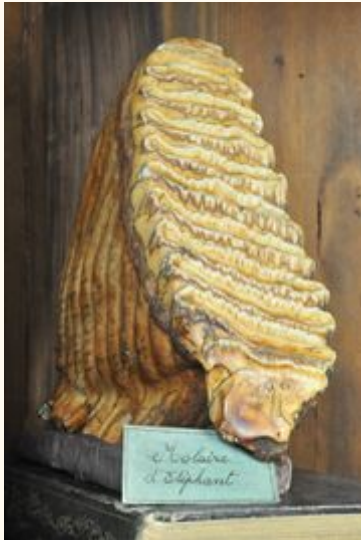
Molaire d'éléphant d'Asie