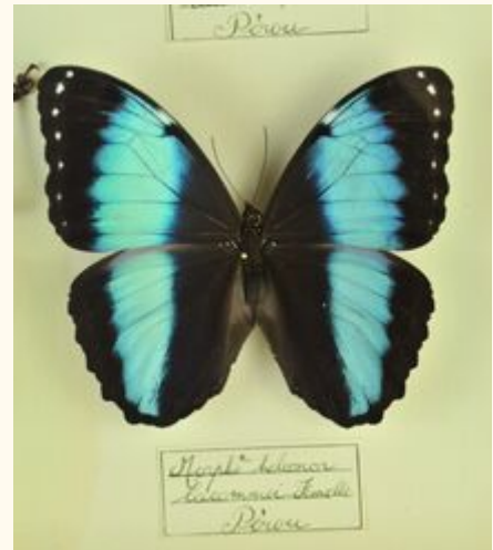
Papillon Morpho helenor lacommei