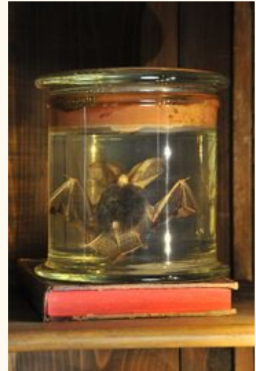
Chauve-souris Oreillard roux