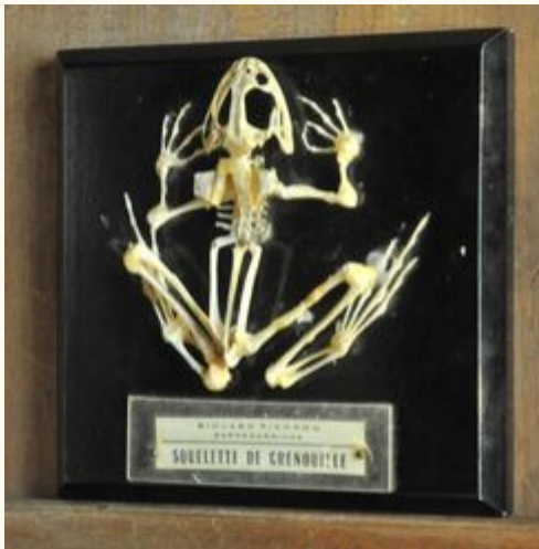
Squelette de grenouille